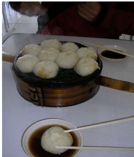
Unser Frühstück, „baozi“