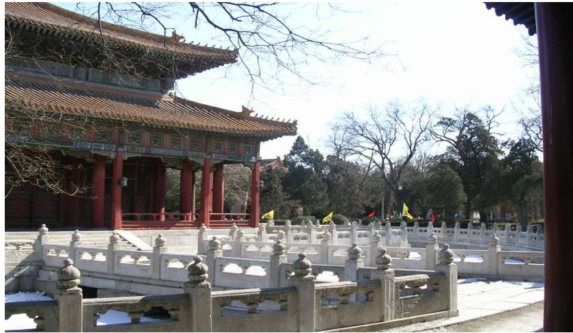
In der kaiserlichen Akademie